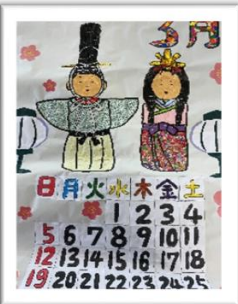
季節のカレンダー 貼り絵作品